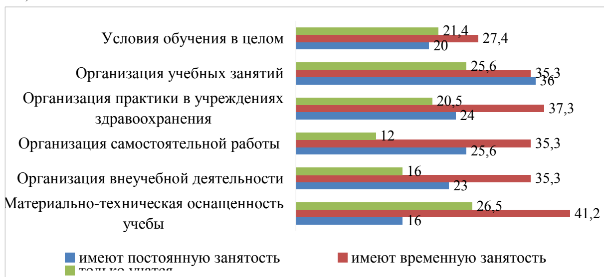
Рис. 4. Условия обучения в колледже: удельный вес респондентов, указавших на низкий уровень удовлетворенности (в % к общему числу по выбранным группам; только учащиеся, имеют временную занятость, имеют постоянную занятость; n_1=117 , n_2=51 , n_3=25 )