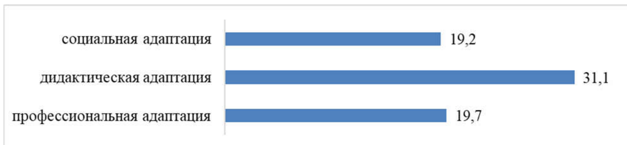
Рис. 5. Адаптация к условиям обучения: удельный вес респондентов, продемонстрировавших низкий уровень адаптации (в % к общему числу; n=193)

С другой стороны, ответы студентов косвенно свидетельствуют о тех барьерах социально-педагогической адаптации, которые сформированы у них в социальной, дидактической (учебной) и будущей профессиональной сферах и для измерения которых были использованы анкета (экспресс-диагностика) «Уровень адаптированности студентов» и методические материалы, разработанные М.С. Юркиной и А.А. Смирновым [11] (рис. 5).