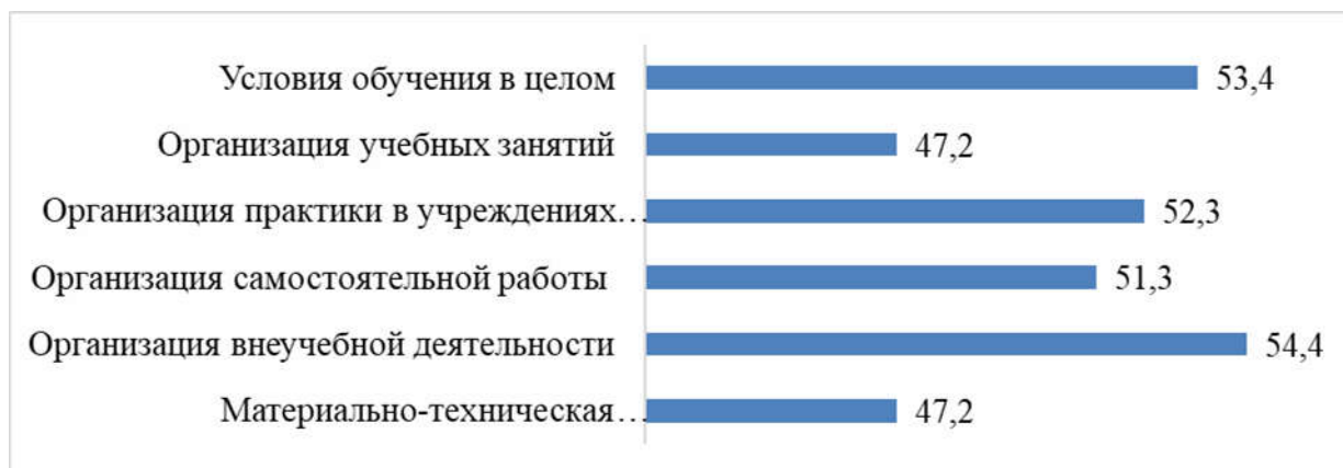
Рис. 1. Условия обучения в колледже: удельный вес респондентов, указавших на высокий уровень удовлетворенности (в % к общему числу, n=193)

В то же время настораживает то, что удовлетворенность условиями обучения в колледже в целом и отдельным выбранным его аспектам средняя (рис. 1): участникам опроса было предложено оценить по 10-балльной шкале, в которой выбор от 1 до 6 баллов означал низкую удовлетворенность, от 7 до 8 баллов – «умеренную», а от 9 до 10 баллов – высокую.